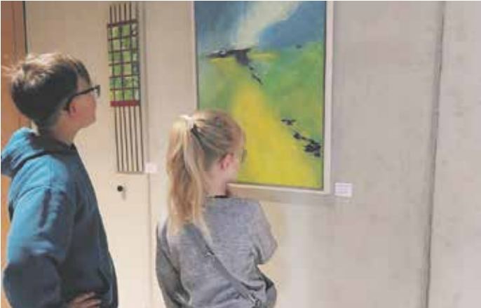
Ausstellungseröffnung im Rathaus für große und kleine Kunstfreunde.

Mit einer gelungenen Eröffnung hat die Gruppe 10x anders am 12. April 2026 Kunst, Musik, Schauspiel und viele Gäste ins neue Rathaus gebracht.