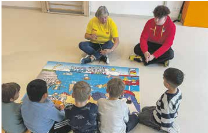
Gemeinsam mit den Mitgliedern der DLRG gestalteten die Vorschul Kinder ein Puzzle zu verschiedenen Notsituationen am Wasser und lernten dabei wichtige Regeln für sicheres Verhalten kennen.

Zum Abschluss des Projekts erhielten alle Kinder eine Urkunde, die sie stolz entgegen-nahmen und später ihren Eltern präsentieren konnten.