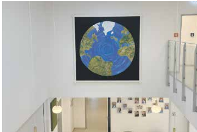
Gemeinsam geschaffen, sichtbar für alle: Das Gemeinschaftsbild der Kinder im Foyer der Kita.