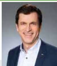
Dr. André Berghegger

Bürgermeister, Rat und Verwaltung der Gemeinde Voltage